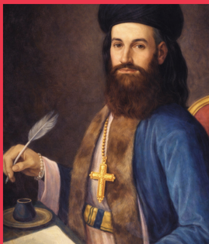
Youssef Tyan, patriarche maronite de 1796 à 1808.

Nommé visiteur apostolique en 1807, il est chargé de rétablir la paix au sein de l'Église maronite à la suite de la démission du Patriarche Youssef Tyan (1796–1808) et de la vacance du siège patriarcal qui s'ensuit. C'est lui qui convoque les évêques maronites à Antoura même, en 1809, pour l'élection du nouveau patriarche, Youhana El-Helou. 3