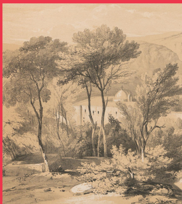
La mission d'Antoura au XVIII e siècle

« Un beau jour, on vint me dire, à l'issue de la messe, que le Patriarche avait mis pied à terre au Séminaire où il m'attendait. Je sortis pour l'aller saluer, mais il me prévint, et je le trouvai à la porte de notre maison, où il entra, suivi de la plupart de ses évêques. Ces prélats nous firent l'honneur de prendre chez nous leur déjeuner et remontèrent à cheval pour prendre le chemin de Louaizeh. » 1