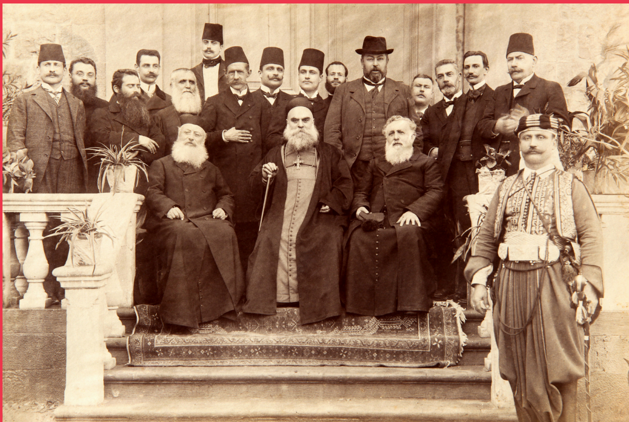
Le Patriarche Maronite Élias Hoyek (1890 à 1931), reçu à la porte d'honneur du Collège par M. Saliège cm, en 1910.

La mission d'Antoura et le Patriarcat maronite entretiennent une relation depuis 291 ans. Cette relation, documentée dans nos archives, remonte à 1735, soit près d'un siècle avant la fondation du Collège lui-même. Cette antériorité est significative : elle révèle que le lien entre Antoura et le Patriarcat s'est progressivement consolidé en traversant successivement les cadres historiques suivants : l'Émirat du Mont-Liban, la Moutassarifat du Mont-Liban, l'État du Grand Liban, puis la République libanaise. Le présent article s'attache à retracer, à partir des documents d'archives du Collège, les étapes de cette relation, depuis la première visite du Patriarche El-Khazen en 1735 jusqu'à la visite de 2026 : près de trois siècles au cours desquels le Collège d'Antoura s'est affirmé, bien au-delà de sa vocation éducative, comme un espace de dialogue, d'arbitrage et de mémoire au cœur de l'histoire maronite et libanaise.