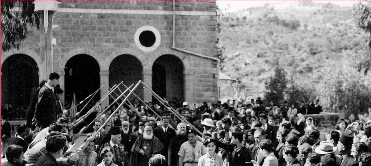
Visite du Patriarche maronite Arida, Saint-Joseph 1940, Collège Saint-Joseph d'Antoura, haie d'honneur formée par les scouts du Collège.

L'histoire de la visite patriarcale à Antoura au cours du XXe siècle est une histoire de reprises et de suspensions, scandée par les grandes crises qui secouent le Liban. Interrompue par la Première Guerre mondiale, la tradition est restaurée sous le Mandat français et se poursuit après l'indépendance de 1943, avec les visites répétées des Patriarches Hoyek et Arida. 12