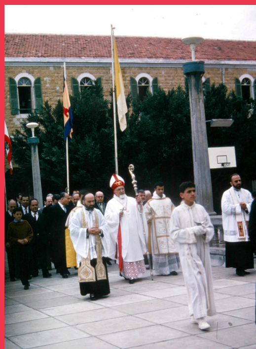
Visite du Patriarche maronite Méouchi, fête de la Saint-Joseph 1965, Collège Saint-Joseph d'Antoura.

De la halte du Patriarche El-Khazen en 1735 à la Saint Joseph de 2026, près de trois siècles de relations continues unissent la mission d'Antoura et le Patriarcat maronite. Hospitalité, médiation, collaboration architecturale, rituel annuel : ces formes successives attestent qu'un établissement d'enseignement est devenu, au fil du temps, un acteur à part entière de l'histoire religieuse et nationale de son pays.